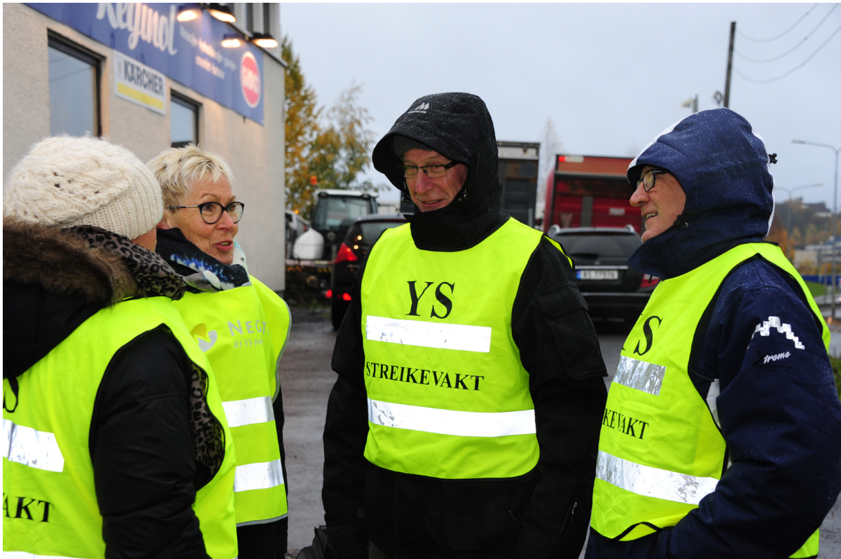
Negotia-medlemmer i streik for å få på plass tariffavtale.

Arbeidsgiver kan nekte streikende adgang til arbeidsplassen etter at streiken er iverksatt. Medlemmet er forpliktet til å utføre arbeid helt frem til iverksettelsestidspunktet, og plikter å forlate arbeidsplassen i slik stand som den normalt forlattes. Dersom arbeidsgivers samtykke foreligger, har streikevakter adgang til arbeidsplassen.