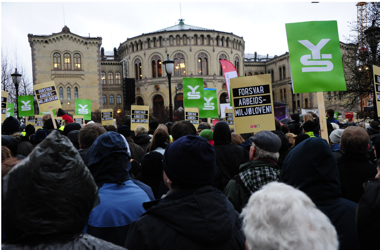
I januar 2015 gikk en samlet fagbevegelse til politisk streik i protest mot planlagte endringer i arbeidsmiljøloven.

Det hender at arbeidsgiver ber om dispensasjon for en eller flere arbeidstakere begrunnet i at streiken gir store skadevirkninger. Lokal tillitsvalgt skal ikke behandle dispensasjonen. Slike dispensasjoner skal behandles av Negotias sentralt.