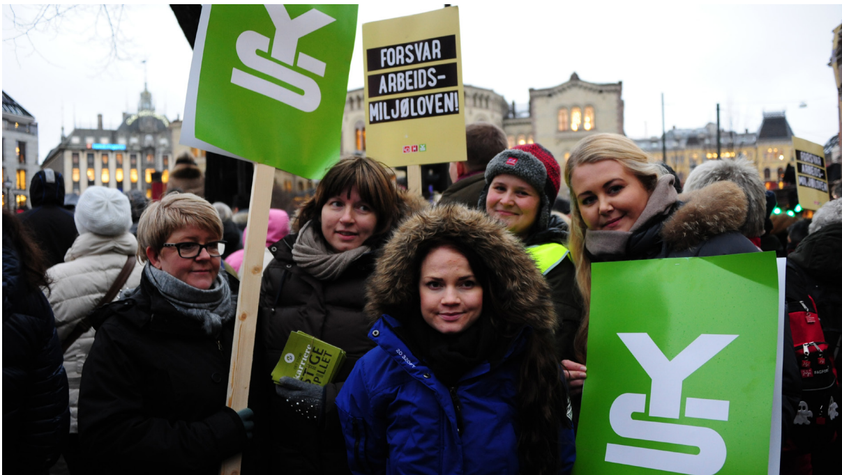
Politisk markering foran Stortinget mot endringer i arbeidsmiljøloven.

Vedleggene er nyttige for praktisk gjennomføring av de oppgavene som er knyttet til streikeforberedelsene.